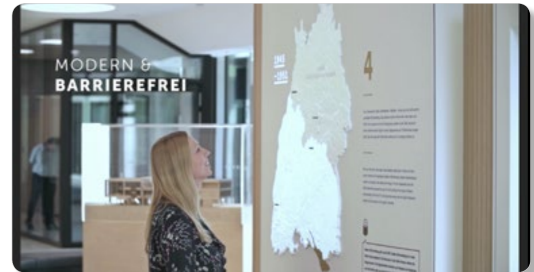
IMAGEFILM Jetzt anschauen.