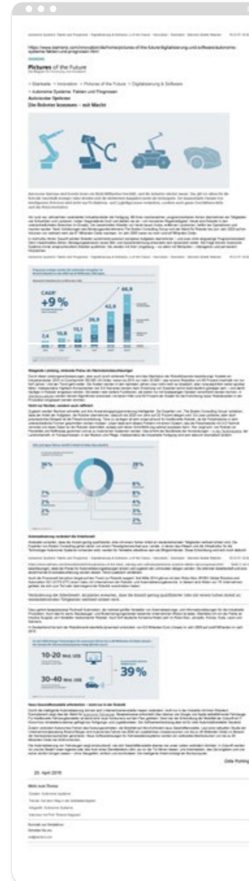
FACHARTIKEL INKL. SORGFÄLTIG AUFBEREITETER INFOGRAFIKEN ZEIGEN ZUKUNFTSTRENDS.